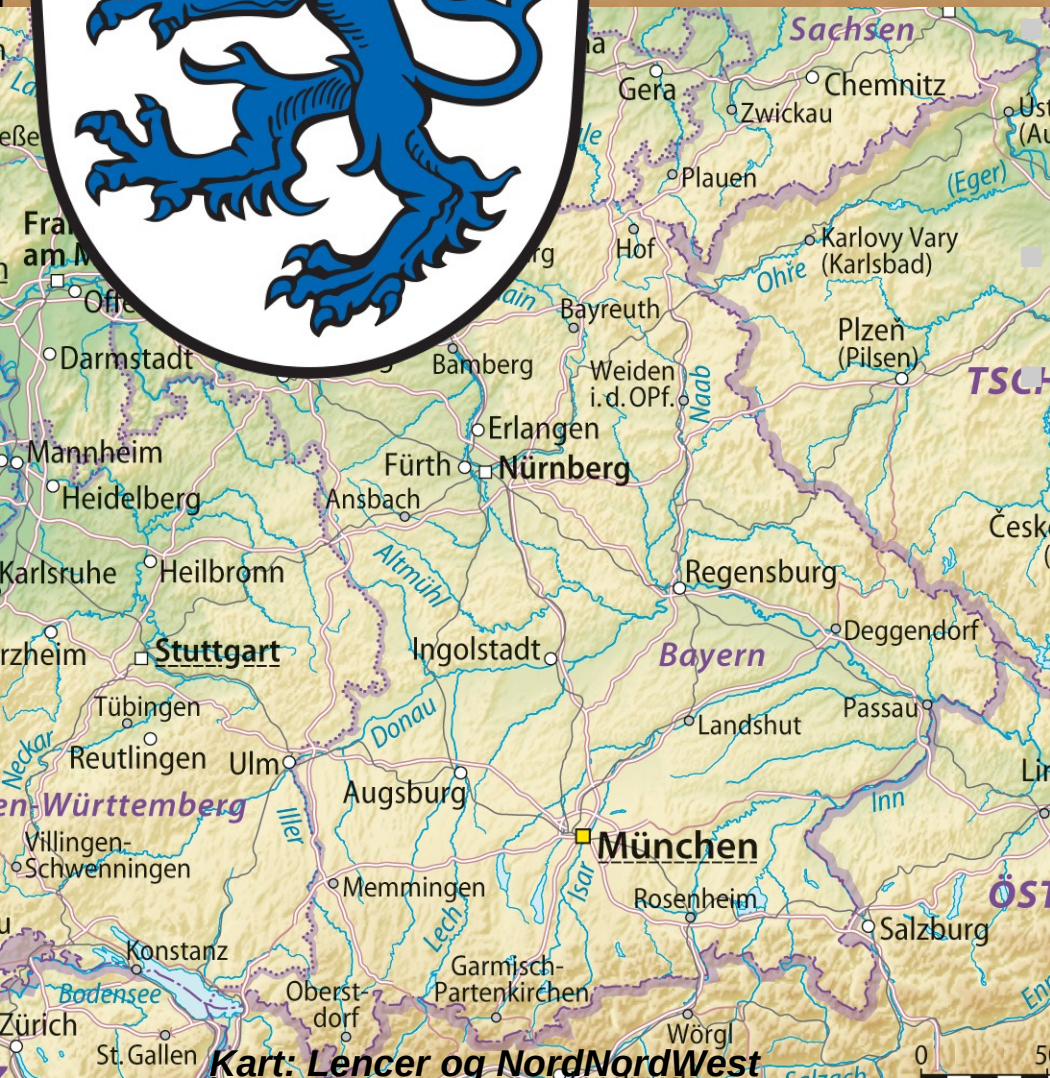
Kart: Lencer og NordNordWest

Vedtatt på landdagen i Ingolstadt 23. april 1516 Signert av Wilhelm IV ... neppe den passasjen i lovteksten de ville tippet at folk fremdeles kranglet om 500 år senere.